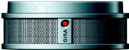
(Optischer Rauchmelder Fabr. Gira)

Brandrauch ist in jeder Wohnung und für jeden Menschen ein ungebeter und vor allem unerbittlicher Gast. Der entstehende Schaden ist unermesslich. In der Bundesrepublik sind pro Jahr mehr als 800 Tote bei Bränden in Wohnungen und Eigenheimen zu beklagen. Brandrauch füllt innerhalb kurzer Zeit nach Brandausbruch eine Wohnung vollständig aus. Der hohe Kohlenmonoxidgehalt im Rauch lässt schlafenden Personen bewusstlos werden. Häufig tritt der Erstickungstod schon ein, bevor die Feuerwehr überhaupt alarmiert ist. Tun Sie etwas für die Sicherheit Ihrer Familie. Nutzen Sie im häuslichen Bereich Rauchmelder als ein lebensrettendes Frühwarnsystem.